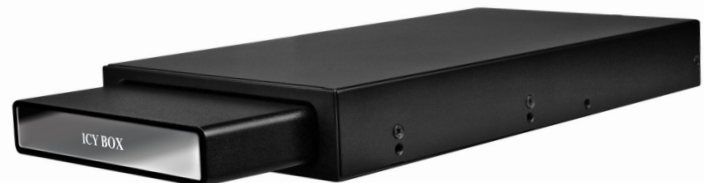
IB-290StUSD-B Externes Gehäuse mit 3,5" Dockingstation