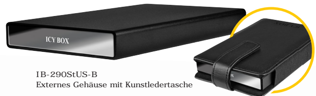
IB-290StUS-B Externes Gehäuse mit Kunstledertasche