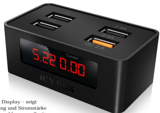
QC 2.0 Display - zeigt Spannung und Stromstärke des angeschlossenen Gerätes