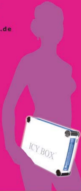
ICY BOX IB-550